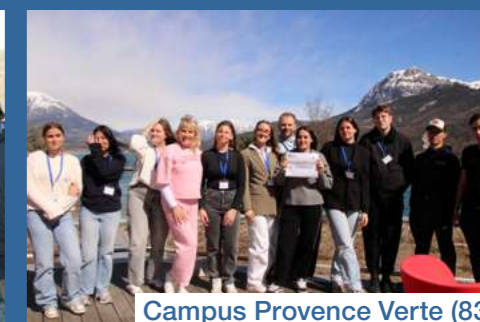
Campus Provence Verte (83)