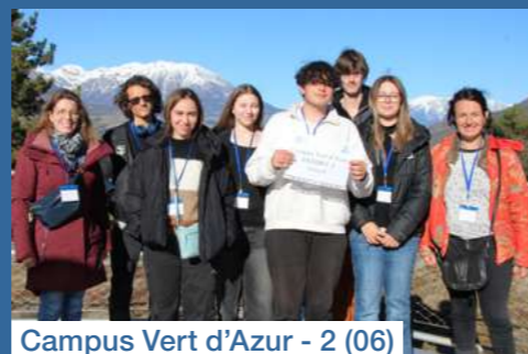
Campus Vert d'Azur - 2 (06)