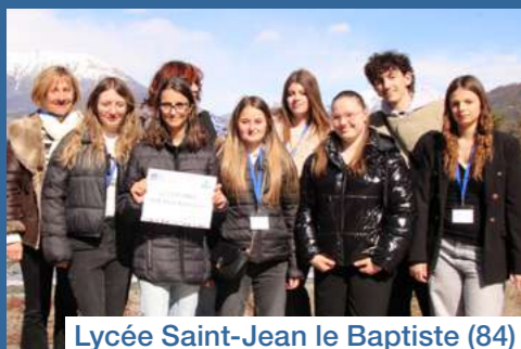
Lycée Saint-Jean le Baptiste (84)