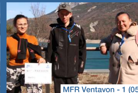
MFR Ventavon - 1 (05)