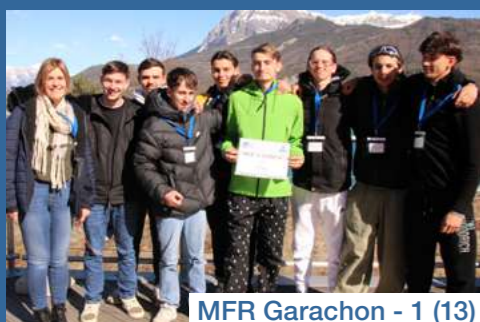
MFR Garachon - 1 (13)