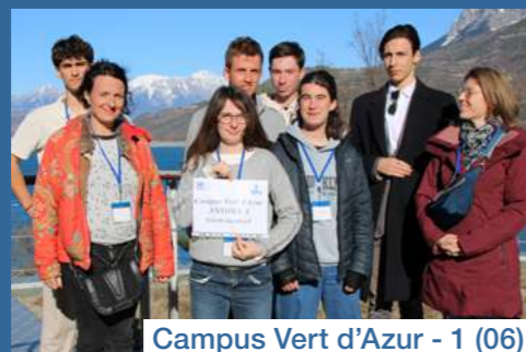
Campus Vert d'Azur - 1 (06)