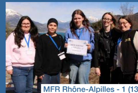
MFR Rhône-Alpilles - 1 (13)