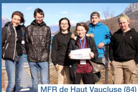
MFR de Haut Vaucluse (84)