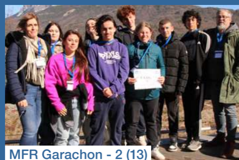
MFR Garachon - 2 (13)