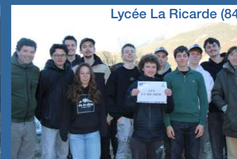
Lycée La Ricarde (84)