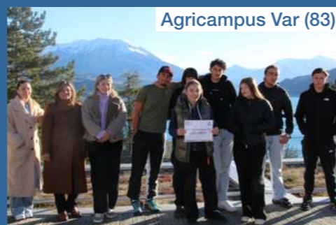
Agricampus Var (83)