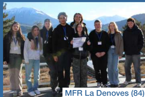
MFR La Denoves (84)