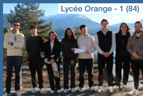
Lycée Orange - 1 (84)