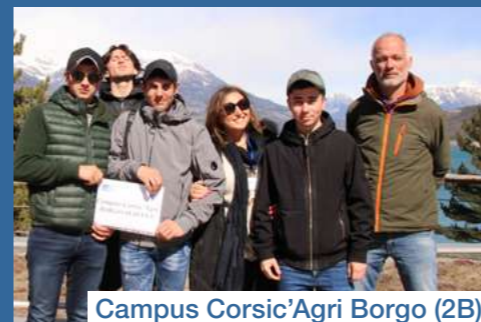
Campus Corsic'Agri Borgo (2B)