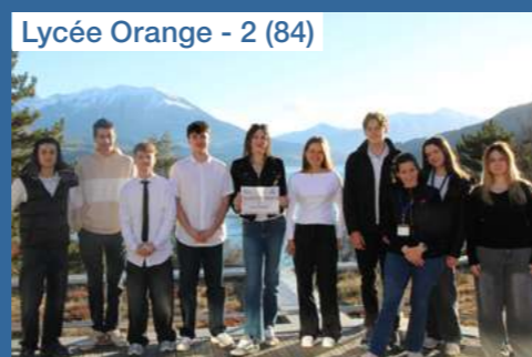
Lycée Orange - 2 (84)