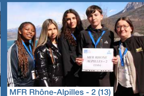
MFR Rhône-Alpilles - 2 (13)