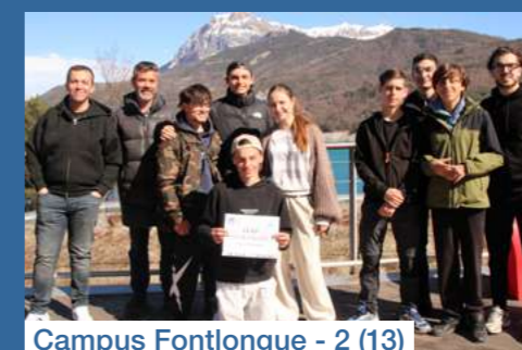
Campus Fontlongue - 2 (13)