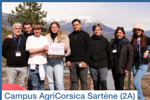
Campus AgriCorsica Sartène (2A)