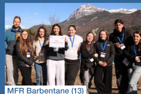
MFR Barbentane (13)