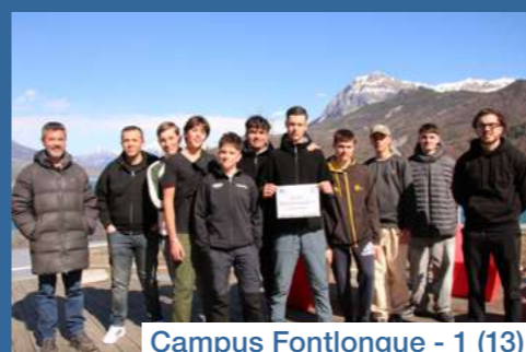
Campus Fontlongue - 1 (13)