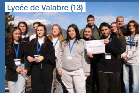
Lycée de Valabre (13)