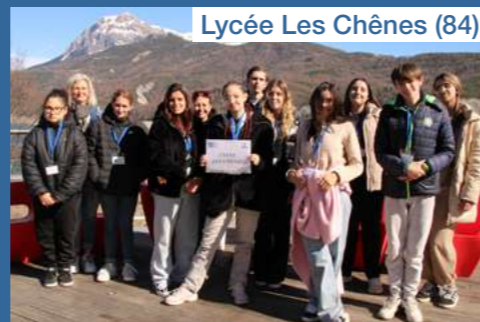
Lycée Les Chênes (84)