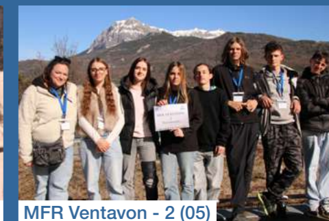
MFR Ventavon - 2 (05)